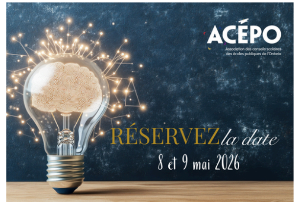
Symposium sur l'éducation publique 2026 Leadership éclairé, gouvernance engagée