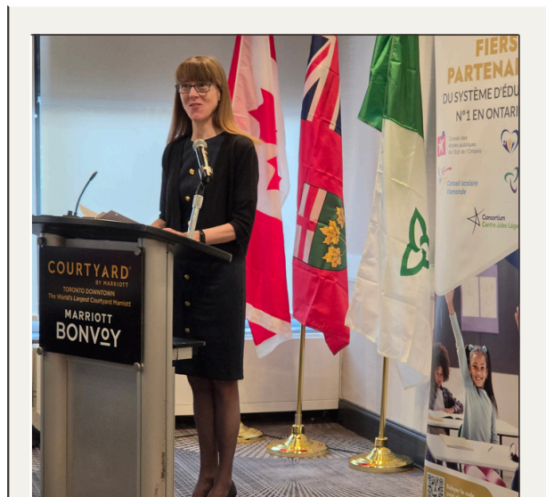
Mot d'accueil de la directrice générale de l'ACÉPO lors de la 1 re journée de l'édition 2026.