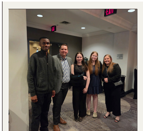
Un groupe d'élèves conseillères et conseillers (et une accompagnatrice) à la soirée Retrouvailles.