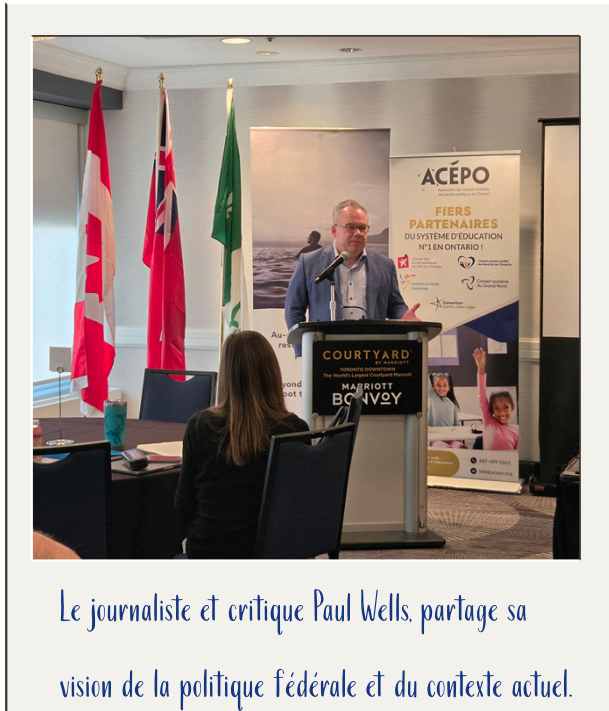
Le journaliste et critique Paul Wells, partage sa vision de la politique fédérale et du contexte actuel.