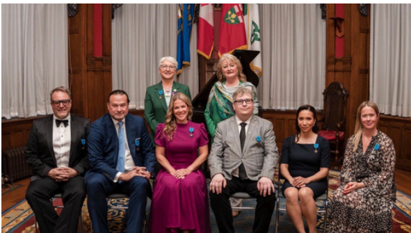
Photo prise lors de la cérémonie tenue à Toronto le 28 mai dernier.

Nous lui adressons nos plus sincères félicitations pour cet honneur pleinement mérité.